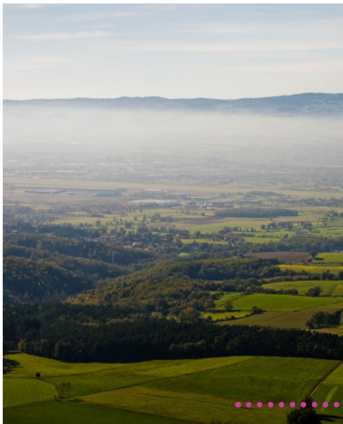
ESPACES NATURELS ET AGRICOLES