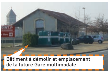
Bâtiment à démolir et emplacement de la future Gare multimodale

Avec la gare multimodale et la construction de l'immeuble AMARYLIS ce quartier sera transformé.