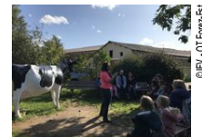
01 Forez-Est

www.la-ferme-des-delices.com/reservations