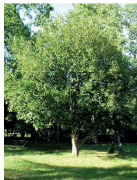
Thuya et Laurier sous forme d'arbres

Ces essences poussant naturellement en hauteur, une plantation serrée et une taille répétée engendrent un blocage de la croissance des arbres. Ils sont alors fragilisés, favorisant ainsi l'apparition de maladies causées par des champignons parasites. De plus la plupart des plants vendus en pépinière étant des clones (identiques entre eux et à la plante mère), la diversité génétique de la haie est donc faible, ce qui augmente la propagation de ces maladies.