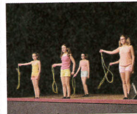
Gala de danse