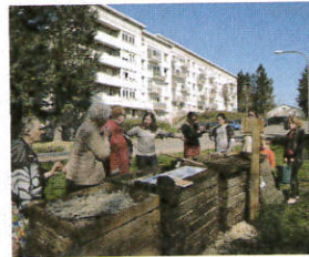
Compostage Com Com