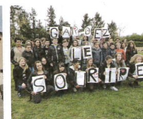
Opération gardez le sourire collège