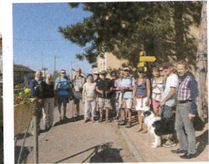
Itinérances douces en bord de Loire