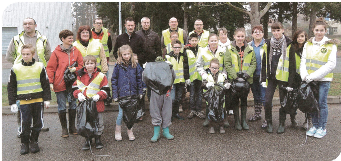
Opération nettoyage CMJ