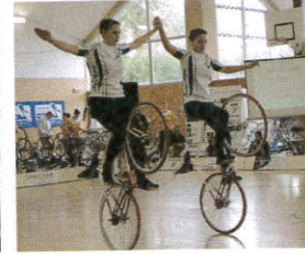
Duo Championnat de France