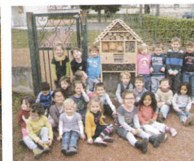
Les Petites Rambertes un hôtel à insectes