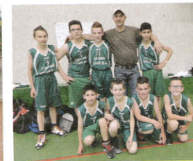
Les U13 en finale