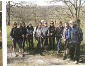
Marche nordique MJC