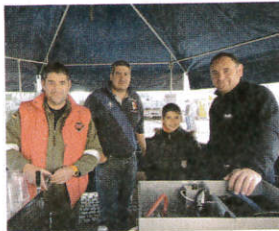
Fête de la bière UCAB