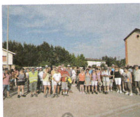
Marche semi nocturne