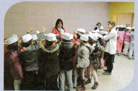
TAP, semaine du goût