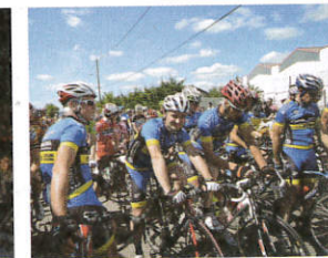
Vélo club de Balbigny