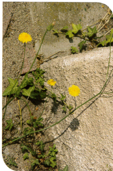
Des trottoirs fleuris pour la santé de tous

* Centre de Formation Professionnelle et de Promotion Agricole