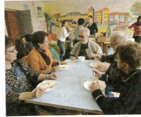
Bol de riz école St-Joseph