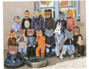
Carnaval école St-Joseph