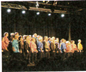
Chorale à travers chants