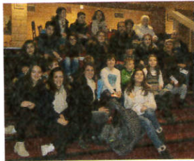
Balbignois à la comédie