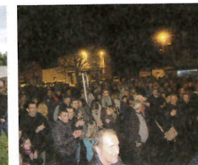
Tirage de l'UCAB