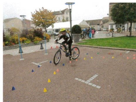
Circuit de maniabilité à vélo, le 10 octobre

«Pendant ces deux années de CMJ nous avons des réunions environ tous les mois. Nous étions un groupe